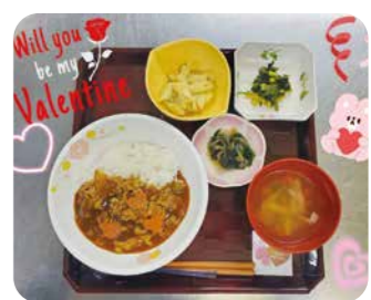
バレンタインメニュー