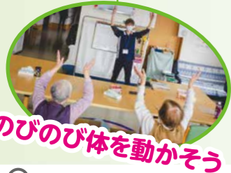
のびのび体を動かそう