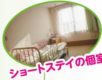
ショートステイの個室