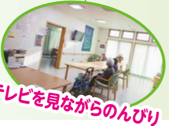
テレビを見ながらのんびり