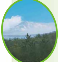
窓から見える鳥海山 日本海