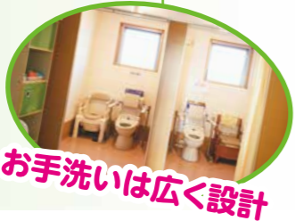
お手洗いは広く設計