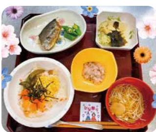
ひな祭りメニュー