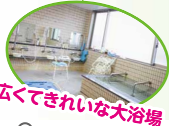
広くてきれいな大浴場