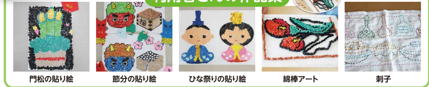
門松の貼り絵 節分の貼り絵 ひな祭りの貼り絵 綿棒アート 刺子