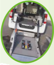
送迎車には車いすのまま乗れます