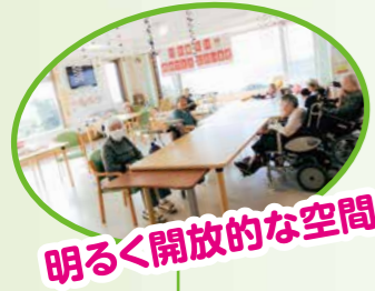
明るく開放的な空間