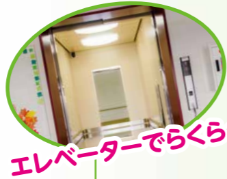
エレベーターでらくらく