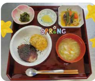
春のお彼岸メニュー